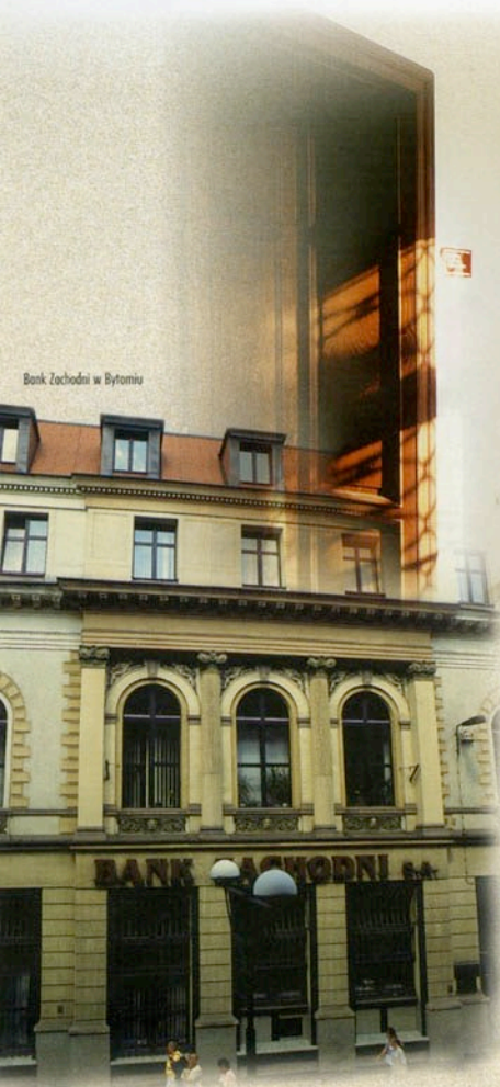
Bank Zachodni w Bytomiu