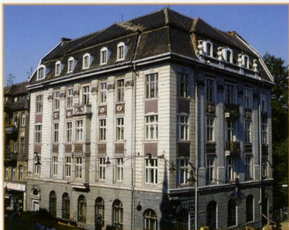
Bank Przemysłowo - Handlowy w Gliwicach